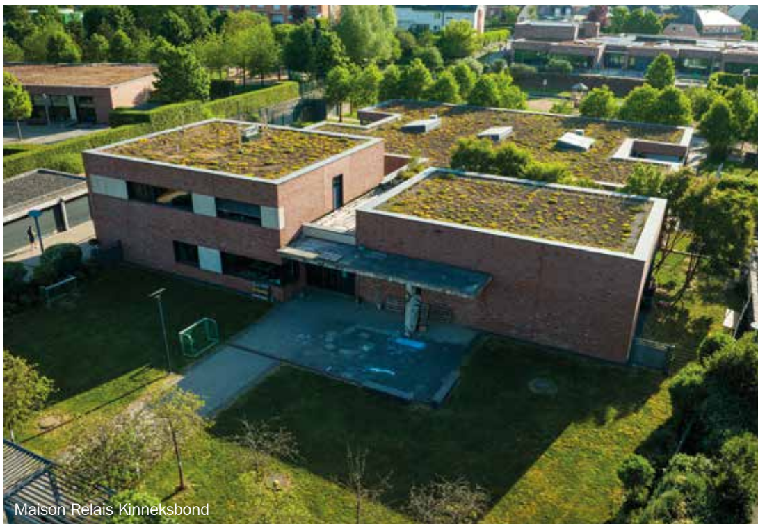
Maison Relais Kinneksbond

Wir setzen uns ein für eine moderne Familienpolitik mit Schul- und Betreuungsangeboten, bei denen jedes Kind seinen Platz findet.