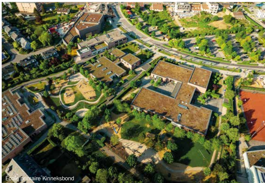
École primaire Kinneksbond

Nous nous engageons dans une politique familiale moderne avec des services scolaires et de garde d'enfants dans lesquels chaque enfant trouve sa place.