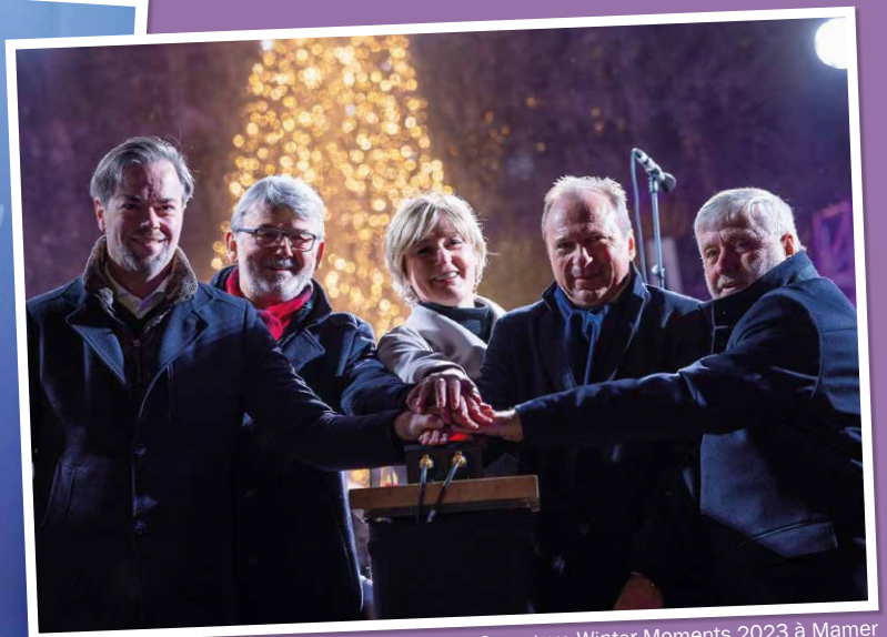
Ouverture Winter Moments 2023 à Mamer