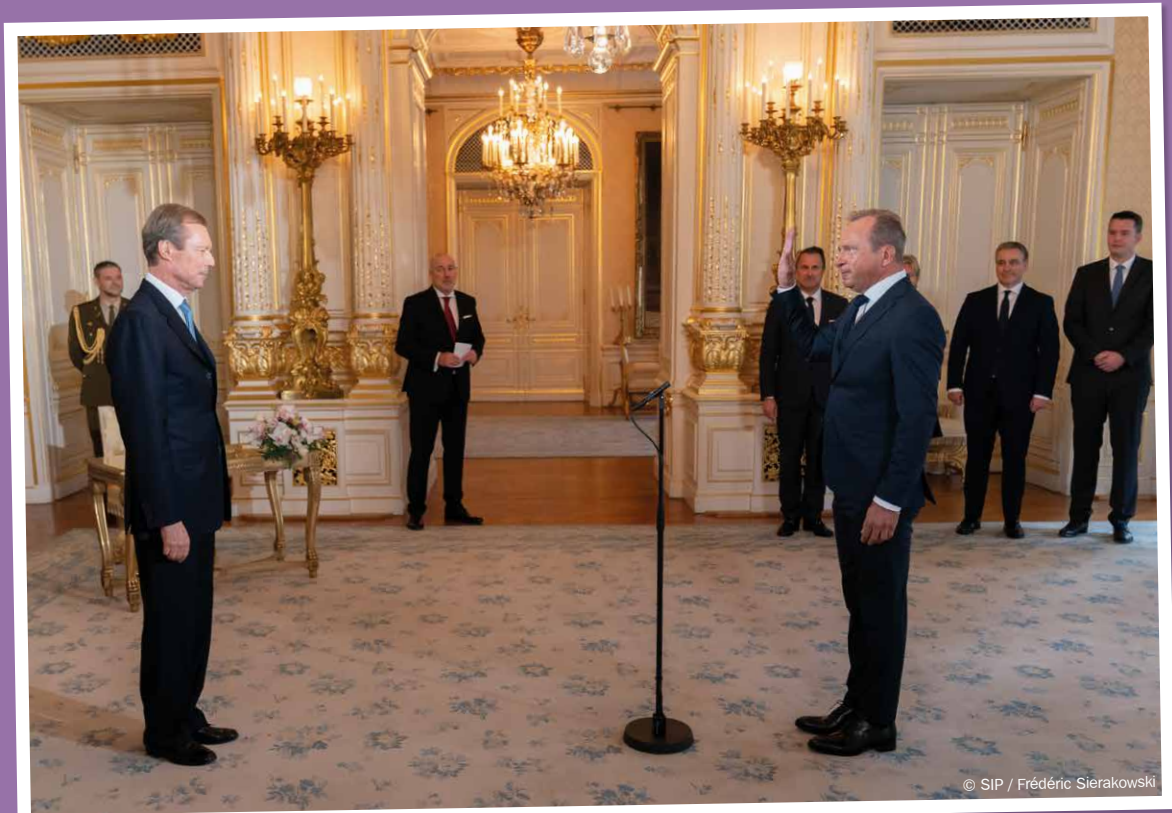
Cérémonie d'assermentation – Prestation de serment de Gilles Roth

No bal 24 Joer als Buergermeeschter vun der Gemeng Mamer gouf de Gilles Roth de 17. November 2023 als neie Finanzminister vereedelegt.