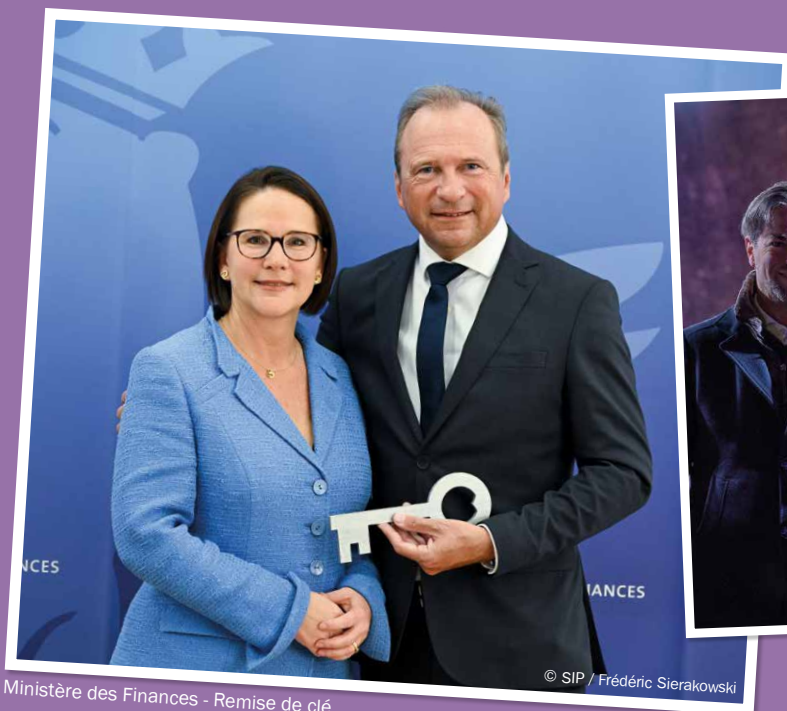
Ministère des Finances - Remise de clé

Mir wënschen him eng glécklech Hand a senger neier Funktioun.