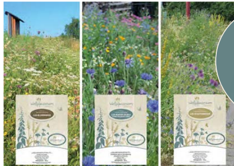
Déi dräi Mëschungen fir de Siidlungsraum. D'Qualitéit gëtt duerch eng Zerifizéierung séchergestallt.

Kommt Iech en Echantillon vun enger LUX- Mëschung an de Guichet vun Ärer Gemengsichen!