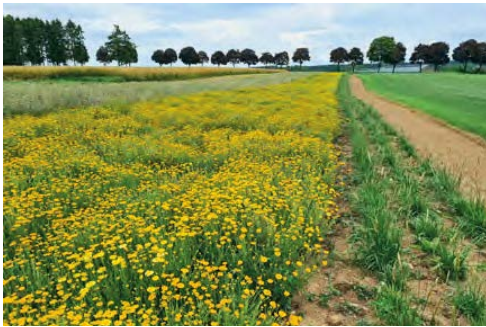
E Feld vum Wëllplanzesom Lëtzebuerg fir d'Produktioun vu Geseems. Dëst gëtt duerno an d'LUX-Mëschungen ageschafft.

Jiderengem, deen eng Blummewiss bei sech doheem am Gaart oder op öffentleche Gréngflächen uleeë wëll, recommandéiere mir d'LUX-Mëschunge vum Wëllplanzesom Lëtzebuerg . Dës Mëschungen enthalen nëmmen Aarten, déi zu Lëtzebuerg natierlech virkommen a wichteg Fudderplanze fir eis heemesch Päiperleken an aner Insekte sinn.