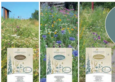
Les trois mélanges LUX pour le milieu urbain. La qualité est assurée par une certification.

Venez chercher un échantillon d'un mélange LUX au guichet de votre commune !