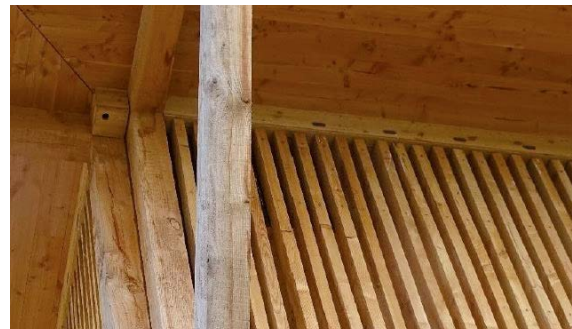
Nistkëschten Veräinshaus Holzem

Weider Informatiounen op: Pour en savoir plus rendez-vous sur : pactenature.lu an/et sicona.lu