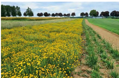
Un champ du Wëllplanzesom Lëtzebuerg pour récolter les semences. Celles-ci sont ensuite incorporées aux mélanges LUX.

Nous recommandons les mélanges LUX de Wëllplanzesom Lëtzebuerg à tous ceux qui souhaitent aménager des prés fleuris chez eux, dans leur jardin ou dans des espaces verts publics. Ces mélanges se composent exclusivement d'espèces naturellement présentes au Luxembourg et étant des plantes nourricières essentielles à nos papillons et autres insectes indigènes.